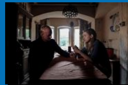
„Znaki” od 10 października w AXN (zobacz oficjalny zwiastun)